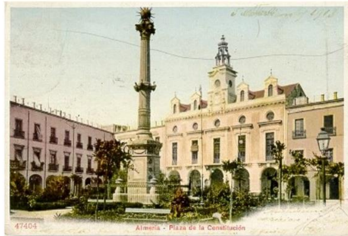
Almería. Plaza de la Constitución : Unión Postal Universal, [ca. 1895] 1 fot. col. (tarjeta postal) ; 9 x 14 cm Ayuntamiento, Monumento a Los Coloraos. -- F-101

Web: http://es.wikipedia.org/wiki/Plaza_de_la_Constituci%C3%B3n_(Almer%C3%ADa)