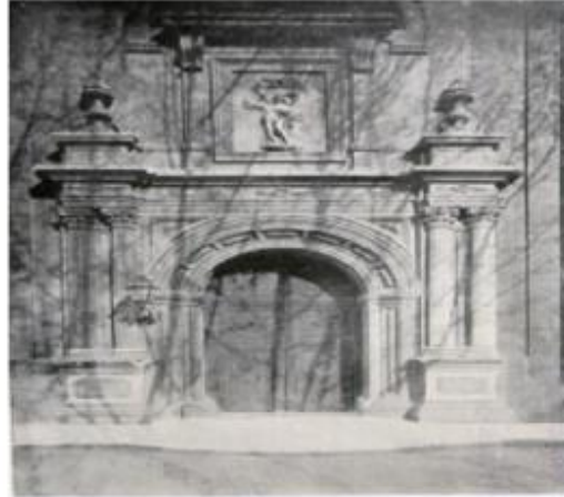
Almería. Iglesia Parroquial de San Sebastián Barcelona: Alberto Martín-Editor, (ca. 1911) 1 fot. ; 18 x 14 cm Portafolio de España . -- P-289

WEB: https://es.wikipedia.org/wiki/Iglesia_de_San_Sebasti%C3%A1n_(Almer%C3%ADa)